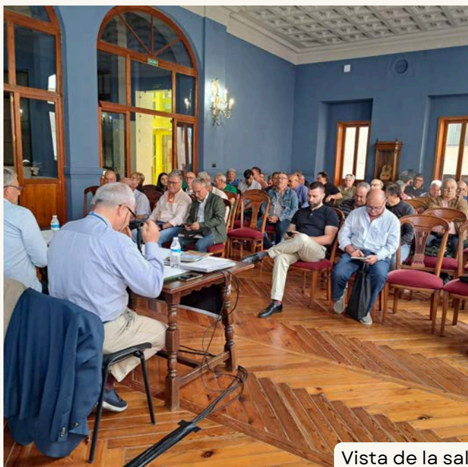
Vista de la sala de conferències