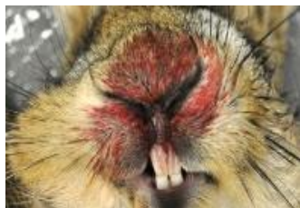
Malaltia vírica hemorràgica