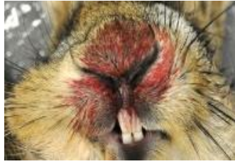
Malaltia vírica hemorràgica